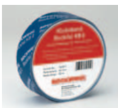
Das Klebeband Rockfol KB2

Die 4/6 cm breite Konterlatte wird nun durch die Spezialschraube TWIN UD mit dem Sparren statisch verbunden.